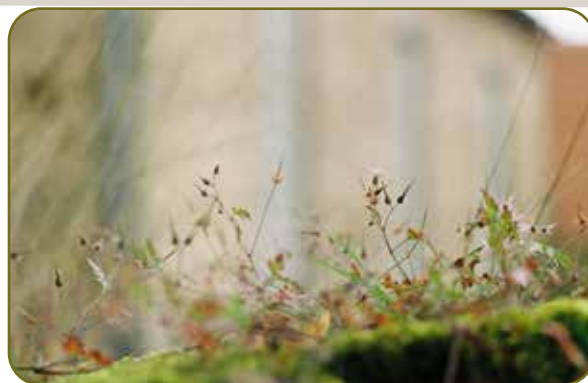
Mauerblümchen auf der Kirchenmauer Afferde, Foto: Sebastian Schlagmann

Letztlich muss er das ja sein. Er hat schließlich alles gemacht - und dann kann es ihm ja auch nicht egal sein. Dafür hat er sich eindeutig zu viel Mühe gegeben. Quelle: EMA